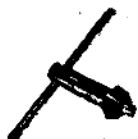
. klička sklíčidla / S 10 /

POZOR ! V zájmu Vaší bezpečnosti používejte jen příslušenství a přídatná zařízení uvedená v návodu, nebo které nabízí příslušný katalog. Použití jiných než uvedených prostředků může přivodit poranění.